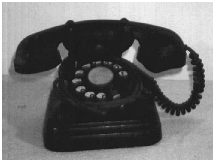
Figura 1. Carcasa de teléfono realizada en Bakelita negra.

“La bakelita fue el primer polímero completamente sintético, fabricado por primera vez en 1909. Recibió su nombre del de su inventor, el químico estadounidense Leo Baekeland. La baquelita es una resina de fenolformaldehído obtenido de la combinación del fenol (ácido fénico) y el gas formaldehído en presencia de un catalizador; si se permite a la reacción llegar a su término, se obtiene una sustancia bituminosa marrón oscura de escaso valor aparente. Pero Baekeland descubrió, al controlar la reacción y detenerla antes de su término, un material fluido y susceptible de ser vertido en moldes” [10].