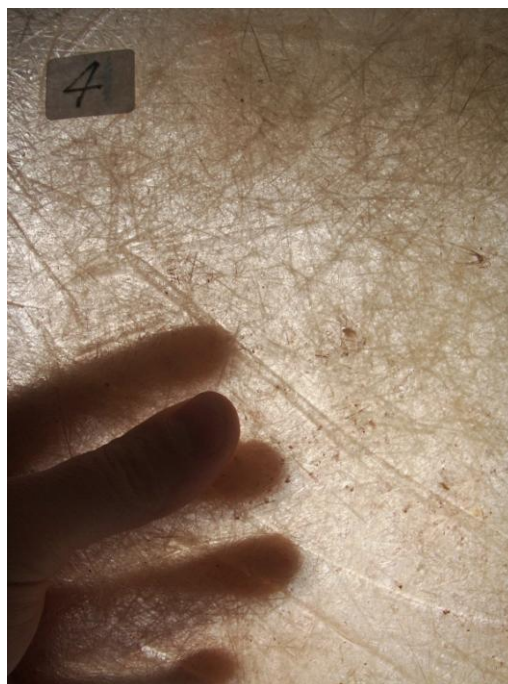
Figura 2. Material compuesto por cuatro estratos de fibra de vidrio Mat embebidos en matriz de poliéster insaturado.

Cabe destacar que a la vez se siguen descubriendo nuevos polímeros como las poliamidas cuyo nombre comercial será el Nylon , descubierto en 1928 por Carothers y el equipo que dirigía trabajando en la DuPont [16]; el politetrafluoretileno cuyo nombre comercial será Teflón, nació casualmente gracias a Roy S. Plunkett cuando trabajaba para la DuPont en 1938 [17], este material se caracteriza por soportar temperaturas de hasta 300°C. También se seguirán estableciendo las bases sobre las que nacerán otros nuevos, todo esto a un ritmo cada vez más frenético. También se seguirán estableciendo las bases sobre las que nacerán otros nuevos, todo esto a un ritmo cada vez más frenético.