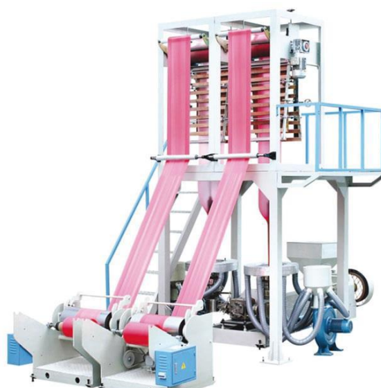
Figura 4. Máquina Extrusora para filme tubular.

Chapas. A produção de chapas pelo processo de extrusão pode ser simples, onde é obtida com um único material, ou multicamadas (co-extrusão) obtida pelo uso de material novo em suas partes externas e material reciclado nas partes internas da chapa, isso reduz o custo sem que seja perdida qualidade de acabamento [6]. O produto final consiste de laminados ou chapas [1]. A produção de chapas pode ser alcançada através de 3 técnicas: