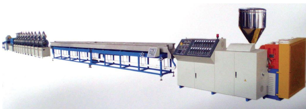
Figura 2. Máquina Extrusora para perfis.

Tipos de moldagem por extrusão. Perfis. O material granulado passa de forma forçada mas controlada para dentro de um cilindro aquecido através de uma ou duas roscas “sem fim”, as quais são responsáveis por transportar, misturar e compactar, além de permitir a saída de gases liberados durante o processo. Na saída do cilindro (Figura 2), o material é comprimido através de uma matriz que tem o formato (desenho) desejado, que dará forma ao produto, em seguida, este é calibrado (com o objetivo de manter suas dimensões), resfriado, cortado (para perfis rígidos) ou enrolado (para perfis rígidos) [1].