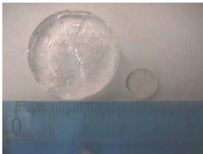
Figura 2. Fotografía de los copolímeros hidrogeles en (a) estado hidratado y (b) en estado seco (xerogel).

Los hidrogeles con alto contenido de ácido llegaron a absorber tanta agua que, cuando estaban alcanzando el equilibrio, había que manipularlos con mucho cuidado para que no se fracturaran (véase la Figura 2). Cuando esto ocurría, había que comenzar nuevamente a recolectar la data para la elaboración de la isoterma con una nueva pastilla seca (xerogel).